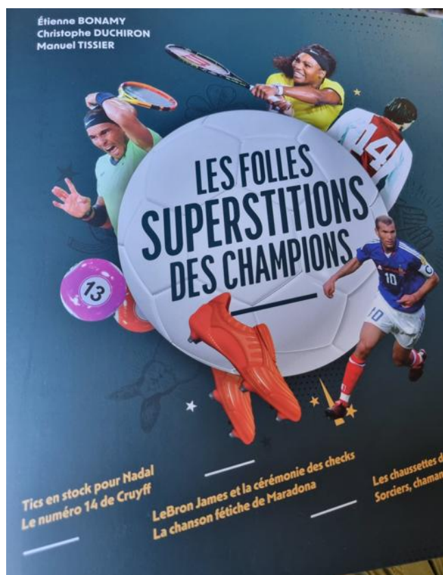
L'ouvrage plonge dans le surnaturel chez les sportifs. Reproduction Sam Bonjean

Comment lui était venue l'idée de « vaudouiser », comme elle dit, l'adversaire. C'était un soir de coupe d'Europe. Après une défaite de 5 buts à Besançon, l'ESBF se déplaçait en Hongrie, à Dunafer. Pendant le déjeuner, elle repère une pomme sur la table. Avec un cure-dent, elle se met alors à graver dans la peau les initiales des adversaires en les piquant ensuite à la manière d'une poupée vaudoue. « En versant aussi du café dessus pour leur cramer le cerveau », ajoute-t-elle. À l'arrivée, les Bisontines ont renversé la vapeur, remonté les 5 buts de retard et se sont